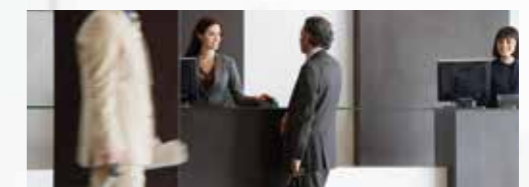
Le secteur de l'hôtellerie