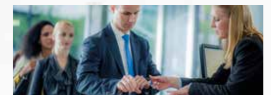
Banken und Finanzinstitute