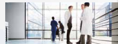
Büroumgebungen im medizinischen Bereich