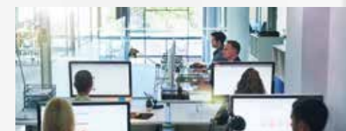
Kleine und mittelgroße Büros und Unternehmensumgebungen